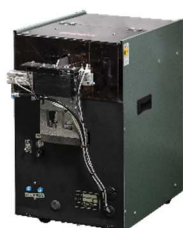
FF801H 取り出し仕様 (ねじ供給装置)