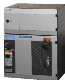
YRC1000 (ロボットコントローラ)